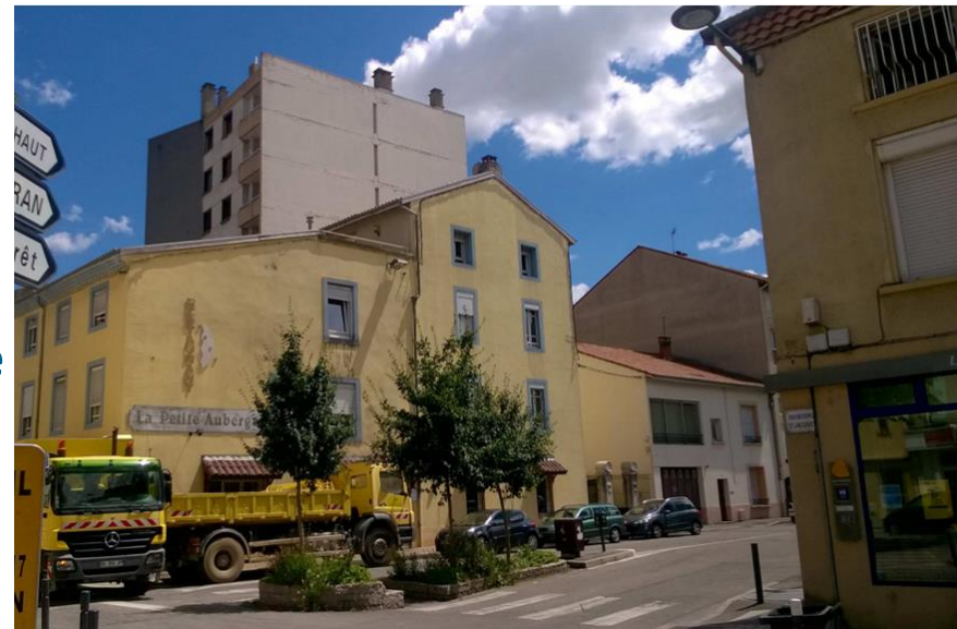
Le restaurant La petite Auberge