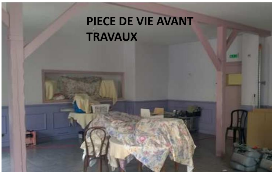
PIECE DE VIE AVANT TRAVAUX