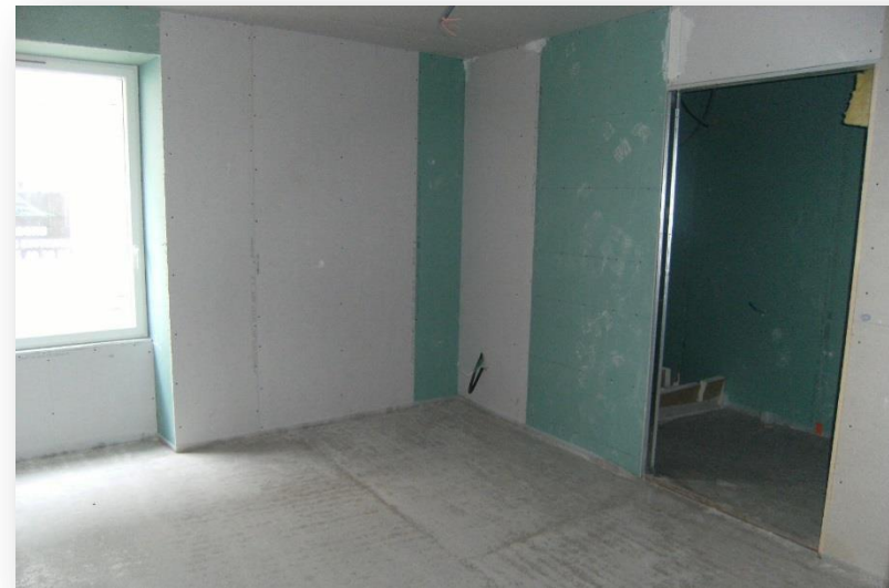
Aménagement d'une porte coulissante