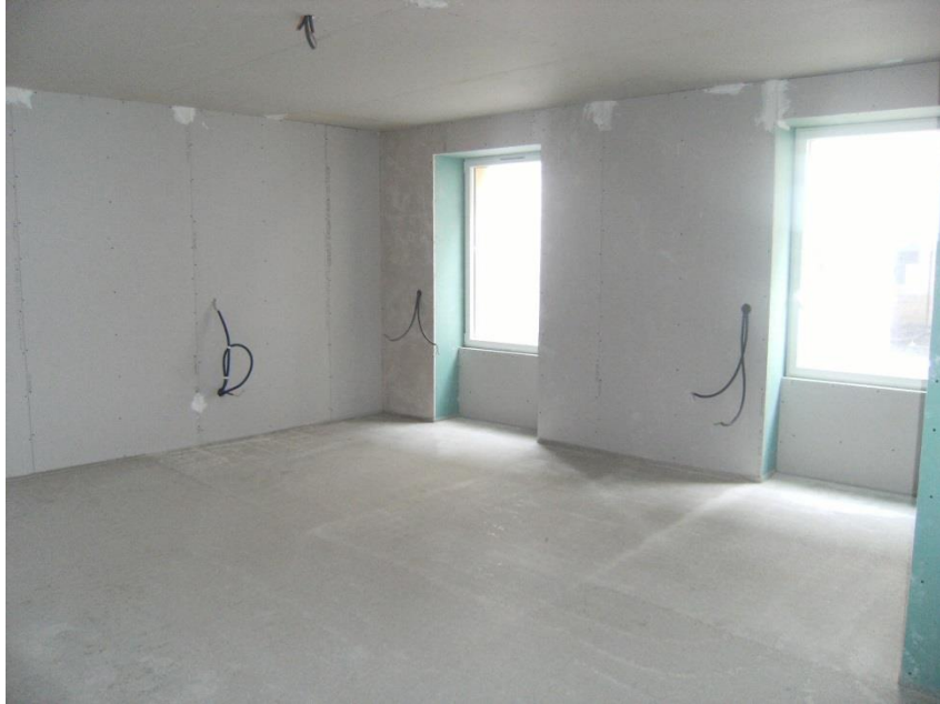
UNE CHAMBRE EN TRAVAUX